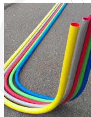
Doorvoerbochten met sprong