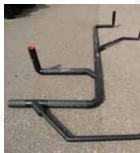
PE Prefab rioleringsset