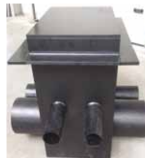
Meterput op maat