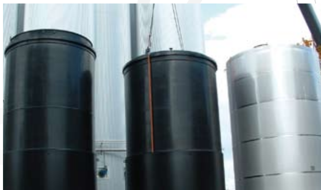
PE tanks voor chemicaliën