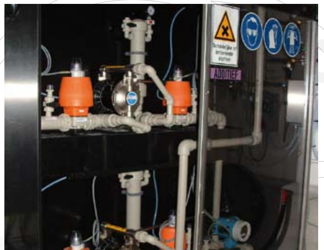
PE verdeelstation salpeterzuur