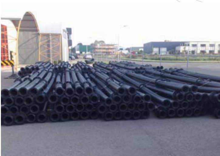
PE drukleiding voor mijnbouw in Ghana