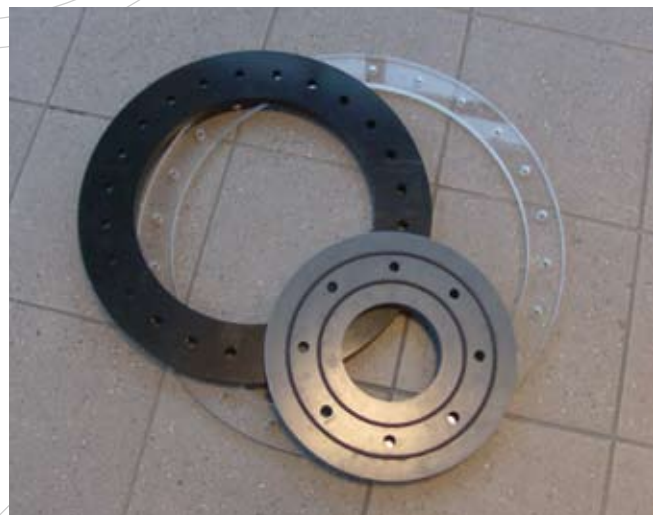
Flenzen van PVC, PE en PMMA