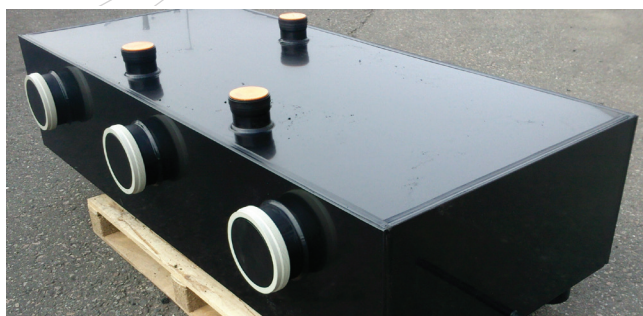
HDPE watertank met diverse aansluitingen

In de loop der jaren heeft Beutech ruime ervaring opgedaan in het meedenken en vinden van oplossingen in de ontwikkeling van specifieke producten en systemen. Voor informatie, advies en mogelijkheden kunt u telefonisch contact opnemen met onze afdeling verkoop, op telefoonnummer 0521-343536. U kunt ook een e-mail sturen naar: verkoop@beutech.nl .