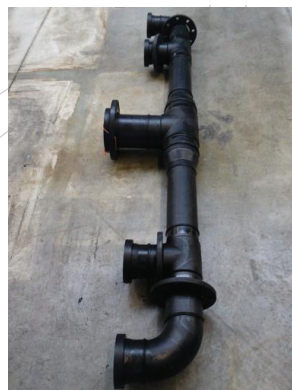
Diverse Prefab leidingdelen...

Beutech Kunststoffen en Bewerking maakt gebruik van moderne CNC-lasmachines en al onze lassers zijn DVS 2207 gecertificeerd. Alleen materialen die door relevante instanties als Lloyds zijn toegestaan worden gebruikt.