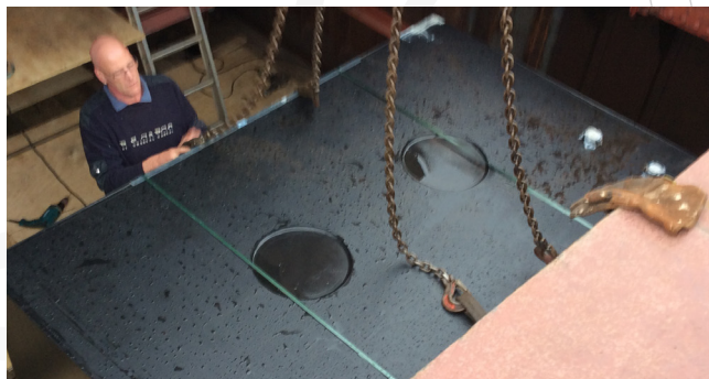
HDPE watertank aan boord