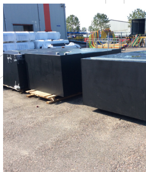
Watertanks klaar voor transport