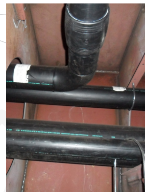
... na installatie aan boord