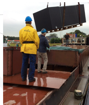
Lossen op de scheepswerf